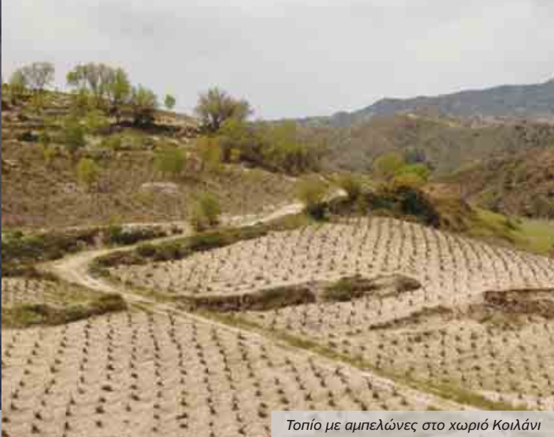
Τοπίο με αμπελώνες στο χωριό Κοιλάνι