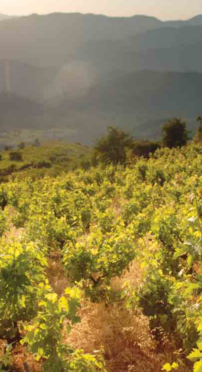
Τοπίο αμπελώνα στο χωριό Βουνί