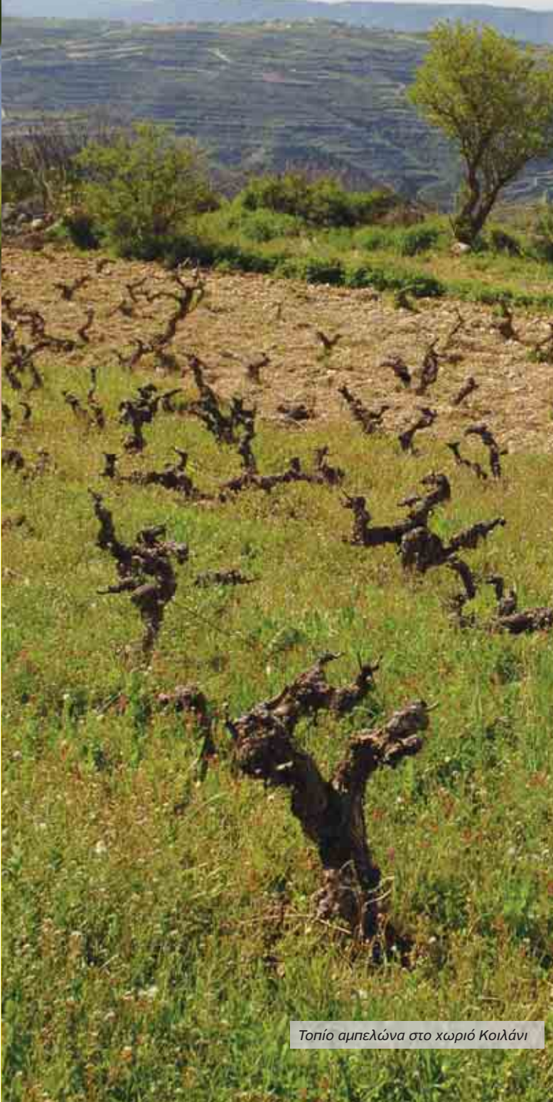
Τοπίο αμπελώνα στο χωριό Κοιλάνι