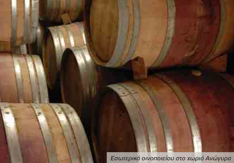
Εσωτερικό οινοποιείου στο χωριό Ανώγυρα