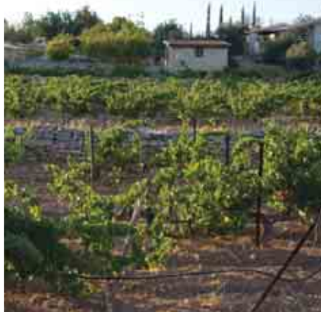
Αμπελώνας στο χωριό Ζαβανάκι

Chardonnay», με ελκυστική μύτη και ώριμα χαρακτηριστικά.