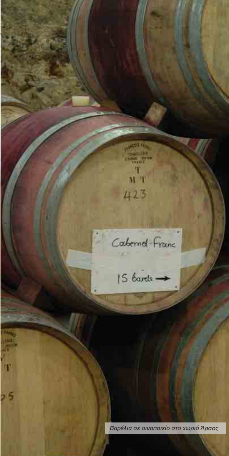
Βαρέλια σε οινοποιείο στο χωριό Άρσος