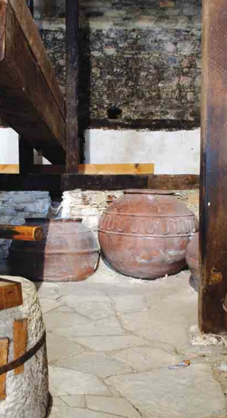
Εσωτερικό παλιού οινοποιείου στο χωριό Όμοδος