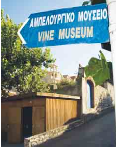
Πινακίδα στο χωριό Κοιλάνι

κέντρο του χωριού. Όπως και σε άλλα οικογενειακά οινοποιεία τα παραδοσιακά «εργαλεία του επαγγέλματος» φυλάσσονται και η χρήση τους εξηγείται στον επισκέπτη. Ο πρώτος όροφος οδηγεί σε ένα εξώστη μεγάλο όσο και το κάτω χτίσμα - ιδανικός χώρος για γευστολόγηση. Εδώ μπορείτε να δοκιμάσετε το ερυθρό «Castellani» και το μώνυμο λευκό ξηρό.