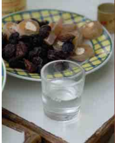
Ζιβανία, το τέλειο συμπλήρωμα των μεζέδων...

διερωτάσαι ποιός Θεός προστάτευε τους ανθρώπους που τις κατασκεύασαν... ίσως ο Διόνυσος να συμμάχησε με το Δία.