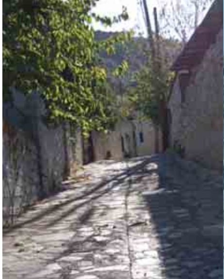
Δρομάκι στο χωριό Κοιλάνι